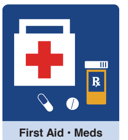
First Aid · Meds