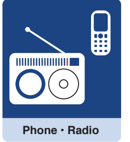
Phone · Radio