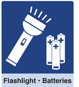
Flashlight · Batteries