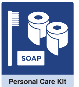
Personal Care Kit